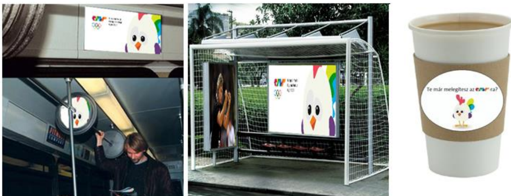
4. ábra Néhány általunk megtervezett marketingelem

A kampány időtartama 2014 nyarától 2017 nyaráig (a sporteseményig) terjed. A médiatervezés során elsődleges szempont a fiatalok figyelmének megragadása volt számunkra, így főként a helyiek környezetébe épített, meghökkentő elemeket (ambient) készítettünk elő. Terveztünk súlyzó alakú buszos kapaszkodót a helyi buszokra (kiemelten az egyetemi járatra), kézilabdakapu alakú buszmegállót, és nyitányként a városközpontban található Vaskakas-szobrot is megszólaltatjuk. A második, tájékoztató fázisban alapvetően PR és direkt marketing elemeket ötvöztünk, többek között pohárgallért terveztünk a karácsonyi vásáron népszerű italokra. A papírgalléron az EYOF előkészületeinek aktuális állása, fontos elérhetőségek és vizuális elemek helyezhetőek el. Mozgásba hoztuk Hugoo-t, a győri olimpiai fesztivál hivatalos kabala-állatát is. Utóbbi olyan jól sikerült, hogy marketingtervünk leadását követően az Önkormányzat nagyon hamar meg is valósította ötletünket. 2014. március 18-án a Győri Audi ETO – Larvik női kézilabda BL mérkőzésen a kezdődobást a kabalakakas végezte el. Kampányelemünk nemcsak a közönség tetszését és figyelmét nyerte el, hanem ráadásként a helyi csapatnak is győzelmet hozott.