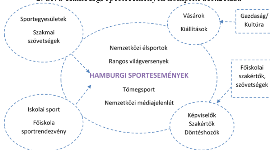
2. ábra Hamburgi sportesemények komplex ábrázolása

Schulke (2007) hamburgi esettanulmányából sok tanulságot szűrhetünk le a sportesemények városmarketingben való alkalmazásáról. A városban éveken át gyakorta szerveztek különböző sportversenyeket, így aztán a városvezetés érdekesnek tartotta a sportváros-koncepció kiépítését, melynek segítségével országon belül és nemzetközi szinten is pozícionálható Hamburg. A tágabb koncepcióhoz hatékony együttműködési rendszert, és erre építkező programtervet állítottak össze, ún. kompetenciaközpontok segítségével. A központ lényege, hogy egységbe tömöríti a hatóságokat, oktatási intézményeket, sportegyesületeket, rendezvényszervezőket, de akár még a sportszergyártókat is, ami összehangolt városfejlesztést tesz lehetővé. A városi beruházásokat, infrastrukturális fejlesztéseket a sportváros-koncepcióhoz igazították.