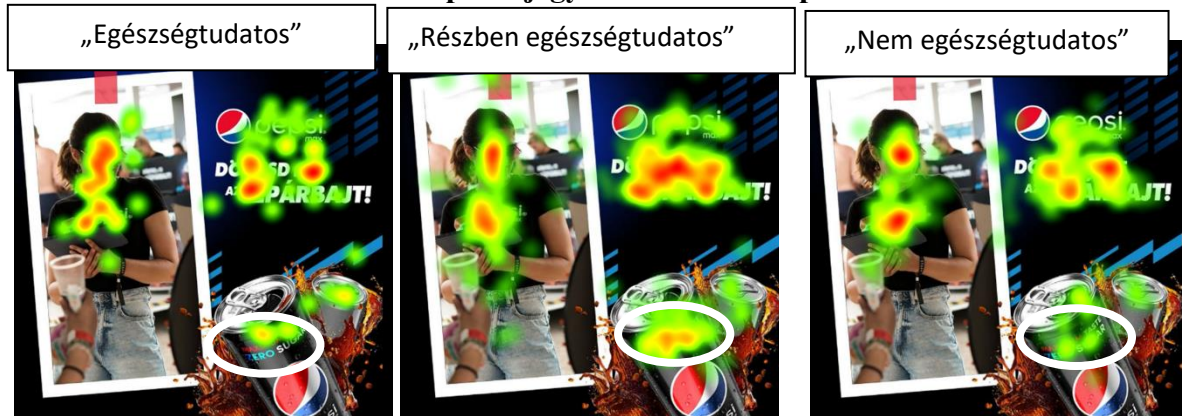
Forrás: szemkamerás vizsgálat elemzése (2023)