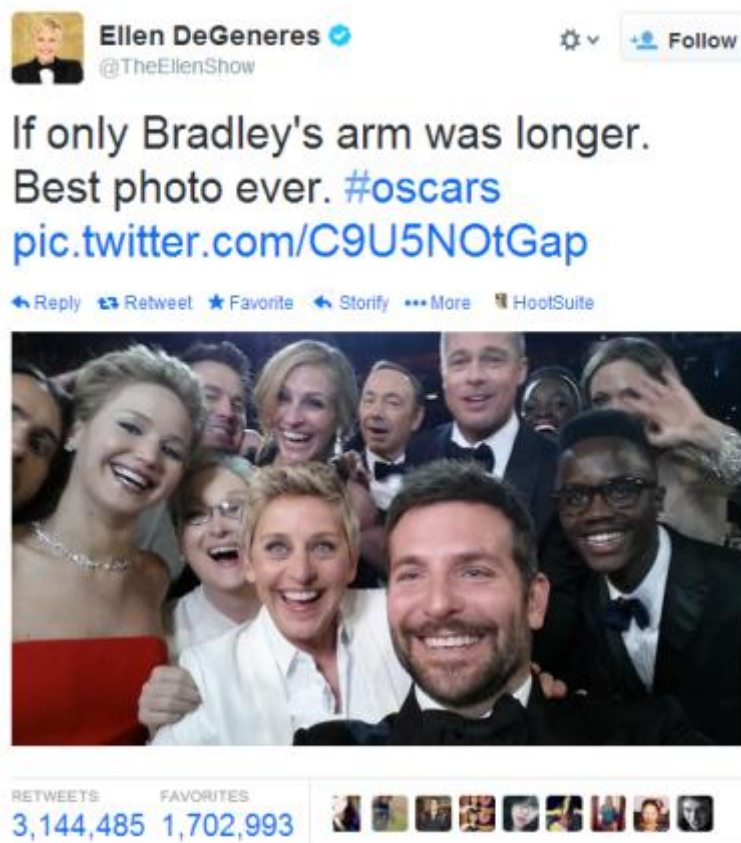
I. ábra Az Oscar-selfie

Egyik legismertebb, már klasszikus példája az „Oscar-selfie” vagy inkább „Oscar-ussie”, melyet Ellen DeGeneres rögzített a 2014-es gálán, s melyet külső nézőpontból további résztvevők is lefotóztak, ami felerősítette a terjedést (lásd I. ábra ).