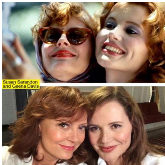
3. ábra Thelma & Louise fotó 1991-ben és 2014-ben

A leggyorsabban terjedő selfie-k hashtaggel működnek. A zeneipar, a politikai kommunikáció, az eseménymarketing már aktívan használja a selfie kulcsszót a közösségi média és a keresőmotorok indexálási logikájához – mielőtt komolyabb kommunikációs zaj alakul ki a selfie-k körül. A legismertebb selfie-k a celebritáshoz és a márkaértékhez kapcsolódóan terjednek, melyhez eleve tartozik identifikáció. A már említett Oscar-fotó alappélda erre. A megjelenő arcok ikonikusak, s magát a 2014-es díjkiosztót is azonosíthatóvá tették. Nem sokat várt egy „ős-selfie” felidézésével egy filmgyári klasszikus sem: a legendás Thelma és Louise hősei 1991-ben egy polaroid géppel készítettek képet magukról egy road movie felütéseként (lásd 3. ábra). A rajongói nosztalgián kívül is marketing értékkel bír a twittelt és vírusszerűen elterjedt képpár. Az ikonikus fotó-remake és a blogoszférában/közösségi médiában terjedő elemzések felhívták a figyelmet olyan ismeretekre is, mint például a film besorolása: a legjobb 100 hollywoodi mozi között tartják számon. Ez erősíti a produkció márkaértékét, s felhívja az újabb generációk figyelmét erre az értékre, ösztönözve a (fizetős/legális) letöltéseket.