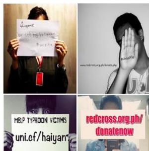
4. ábra Selfie-ellentrend

Így jutunk el az ellentrendig, az unselfie-ig, mely már trendreflexióként működik. Az itt kiemelt példa üzenete: kevesbé projekt módon tegyünk valamit és elmozdulás történjen egy jó irányba („less of a project and more of a do-good movement”). Nicolas Bordas indította el ezt az ellentrendet egy poszttal a LinkedIn professzionális közösségi hálózaton. A kezdeményezés válasz volt a fülöp-szigeteki, tájfun-okozta katasztrófára. A jótékonyági felhívás lényege az volt, hogy a userek „unselfie”-ket használjanak: arcukat takarják el egy darab papírral, melyre támogatási URL-cimeket írhattak. Mindez víruszerűen terjedt a Twitteren és az Instagramon is (lásd 4. ábra).