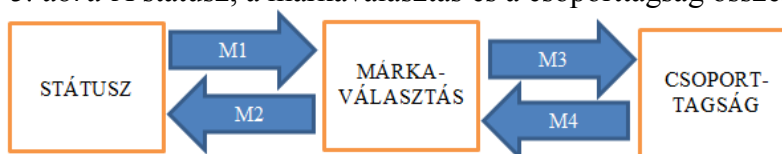
3. ábra A státusz, a márkaválasztás és a csoporttagság összefüggései

A fenti eredményeinket a 3. ábrán foglaltuk össze, mely a kvalitatív kutatásunk eredményeit összegző empirikus modell.